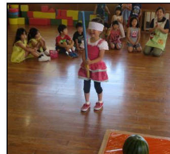
夏の間思いきり遊んだよ！(8/8スイカ割り)