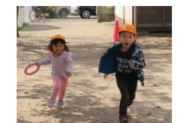
はと組みたいに早いでしょ!!