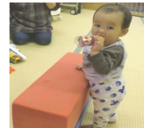
つかまり立ちが上手になったよ!!

秋晴れの中、子どもたちは元気にお外に飛び出していきます。自然の中で様々な体験をしている子どもたち、たくさんの発見が探究心を高めていきます。これからは寒い日が多くなってきますがどんどん戸外へ出て楽しく体を動かし丈夫な体作りをしていきたいと思います。