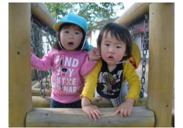
たいこ橋、楽しいね!!