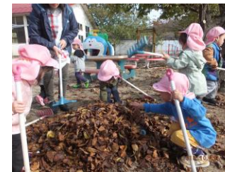
やきいもごっこ楽しいね!