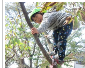
木のぼりも上手になったよ! 「やっほ〜!!」