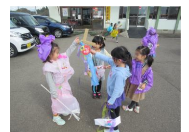
自分たちで作ったハロウィンの仮装、みんなで変身!!